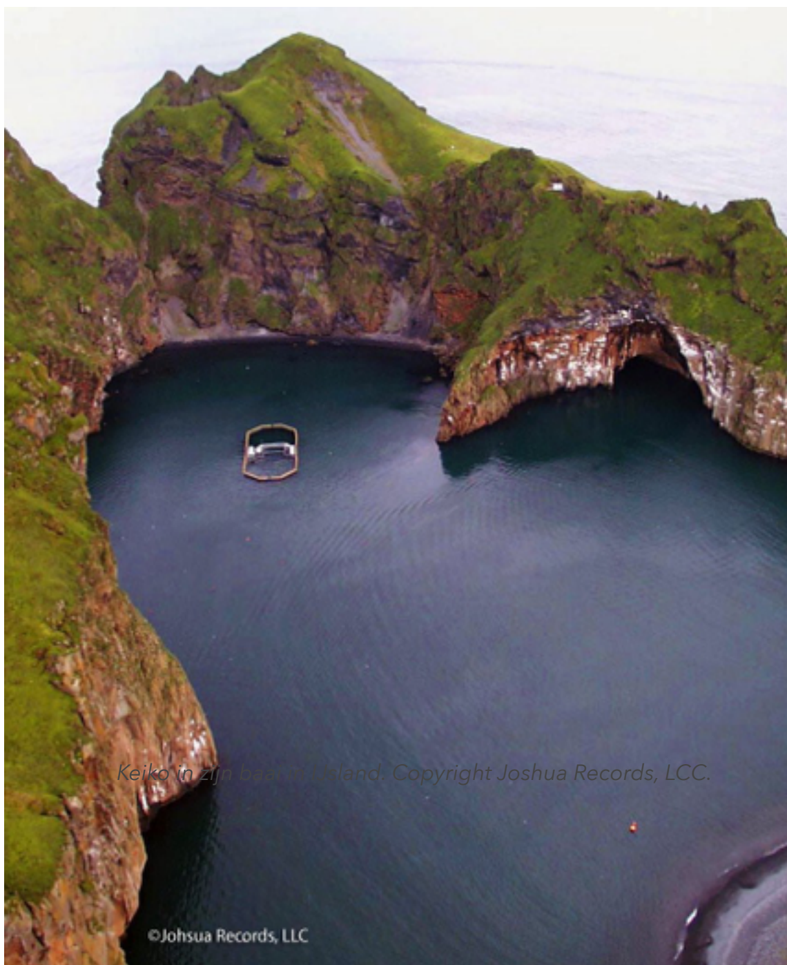
Keiko in zijn baai in Island.