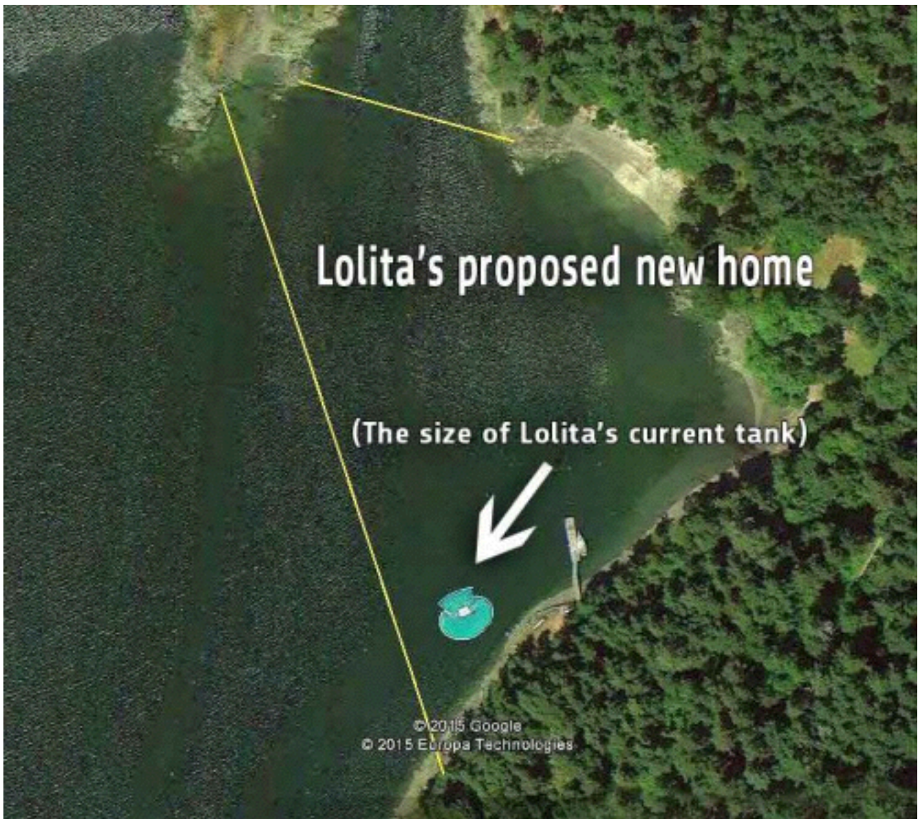
Réserve imaginée pour Lolita.

distance suffisante, des plateformes d'observation pour les visiteurs. Seulement, la réalisation d'un tel plan est évidemment extrêmement coûteuse. Le sanctuaire pourrait se maintenir financièrement dans une certaine mesure grâce à la vente de billets d'entrée, de nourriture, de boissons et de souvenirs aux visiteurs adeptes du "whale watching", mais d'importants investissements initiaux seraient en tout cas indispensables.