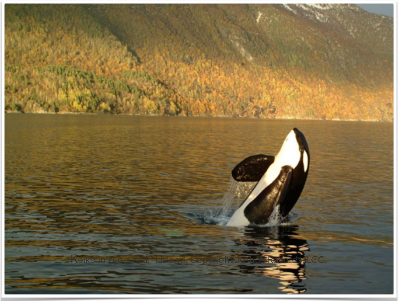
Keiko in zijn baai in Island.

chasser par ses propres moyens. Étape par étape, il a réalisé des incursions toujours plus loin dans l'océan, a eu des interactions avec d'autres mammifères marins et a finalement pu nager librement pendant un an et demi à travers l'océan Atlantique, principalement de l'Islande à la Norvège.