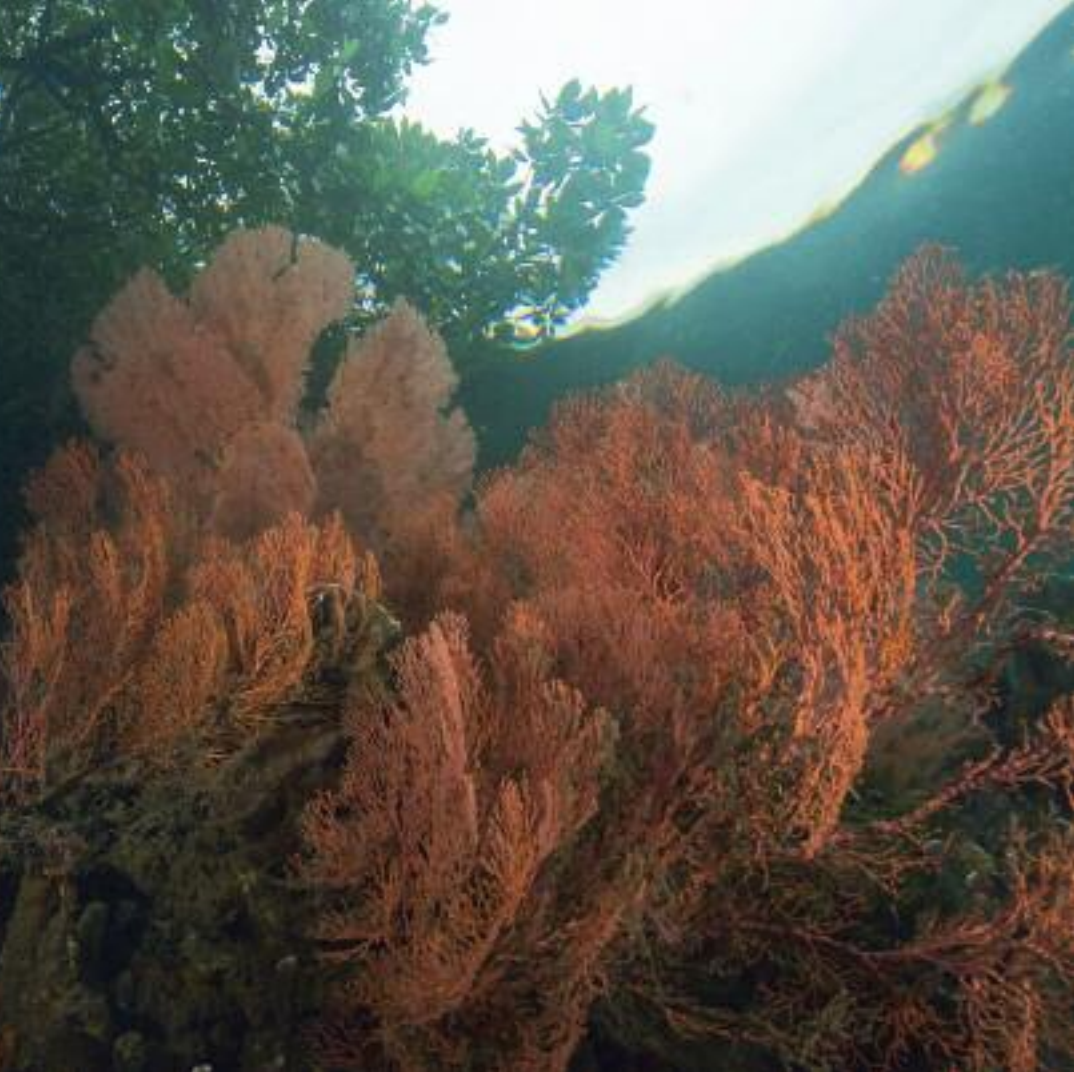
De riffen lopen op veel plaatsen naadloos over in mangrovebos. Prachtige waaierkoralen groeien tussen en op de wortels van de mangroves

wust te maken van het belang van een gezond mariene ecosysteem. Met hun omgebouwde 'educatieschip' varen zij het hele jaar door van dorp naar dorp om de jeugd - en via de jeugd de ouders en dus de plaatselijke vissers - bewust te maken van de nadelen van destructief vissen en het belang van gezonde riffen.