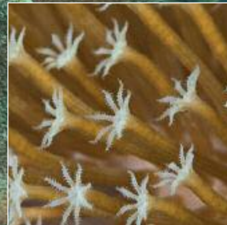
Lederkoraal in groothoek en macro (inzet)