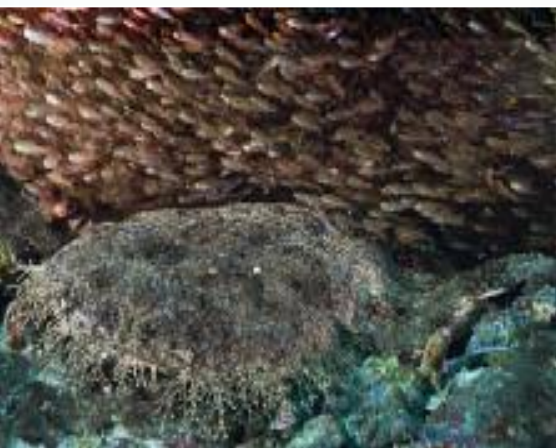
Wobbegong of geklepte bakerhaai

De meest algemene haai die overigens zelden wordt gevangen, is de Wobbegong shark (geklepte bakerhaai). Meestal onbewogen liggend in een grotje, vaak omgeven door glasvisjes, wacht de haai op een voorbijzwemmende prooi. Opvallend is het kleine oog van de haai. Het dier is perfect gecamoufleerd door de vlek-