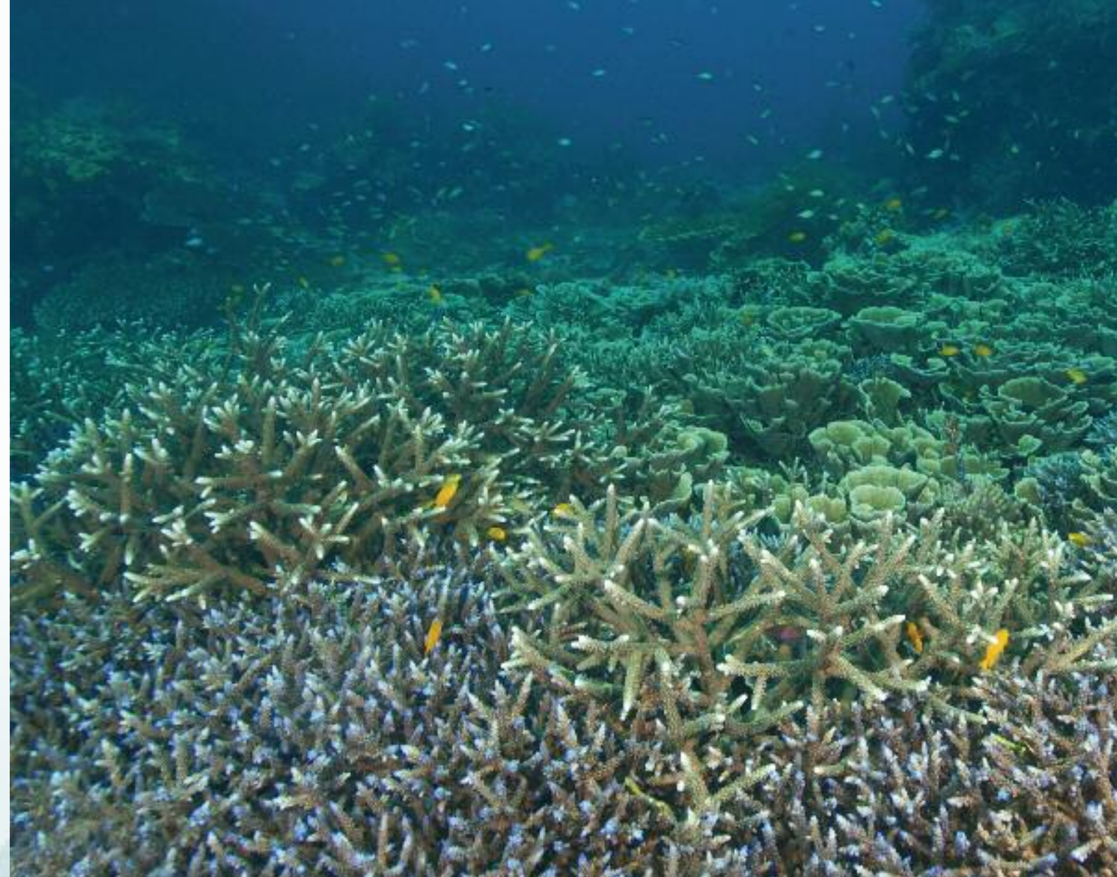
Indrukwekkende velden met het tere herts-hoornkoraal

Het is ook oppassen geblazen voor de mangrovebossen zelf. Vooral inwoners van het niet al te verafgelegen Sulawesi, komen niet alleen vissen in dit gebied, maar kappen er ook de